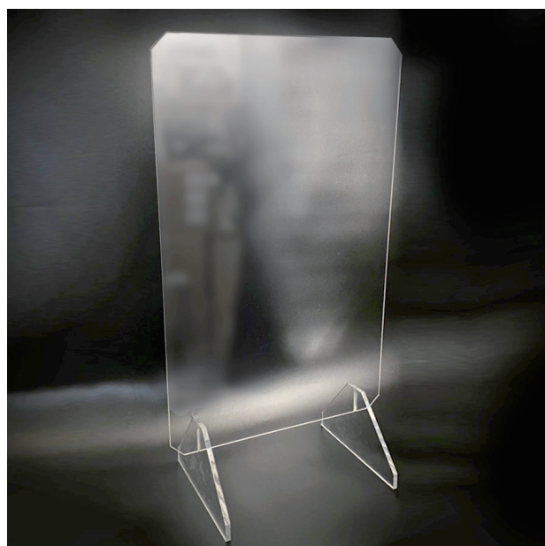
◎縦型 ついたて部 台座有 横430mm×高さ770mm(台座含) 厚み4mm